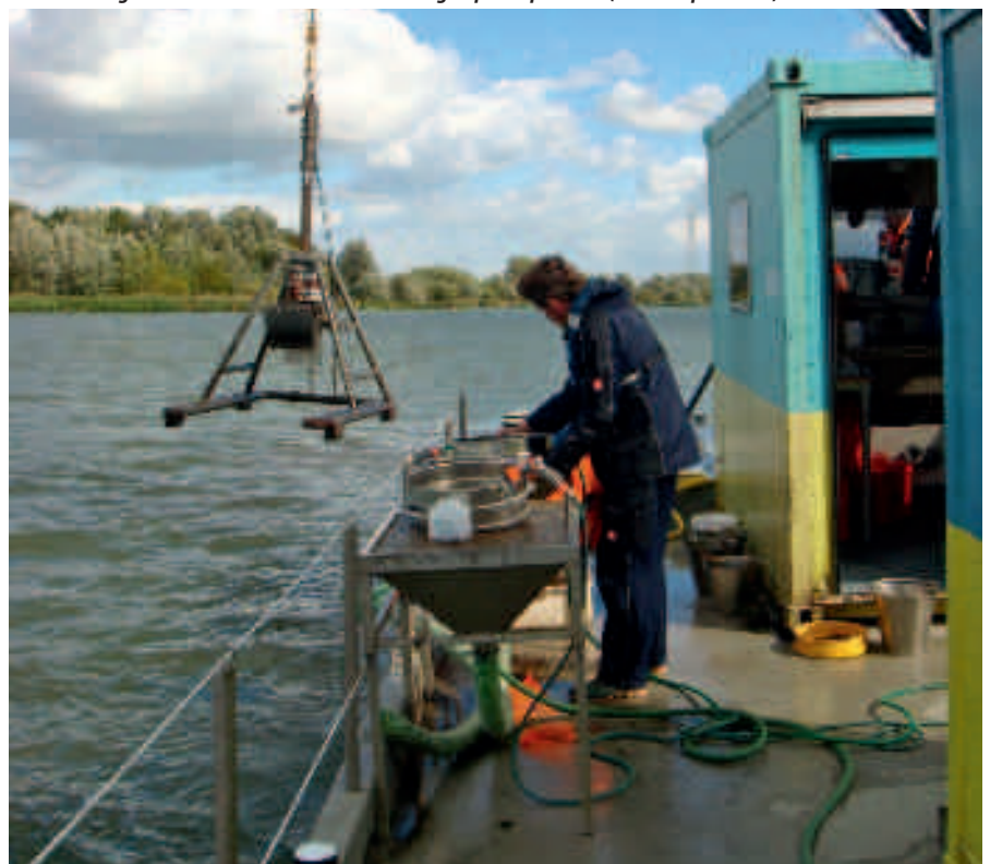
Bemonstering met een Boxcore in de Biesbosch afgelopen september.

Voor het beantwoorden van deze vragen is gebruik gemaakt van de Nederlandse monitoring dataset uit de zoete getijdenwateren, die ook gebruikt werd door Reeze 2) (zie het voorgaande artikel). Van deze gegevensverzameling is een maatlat voor sedimentverontreiniging afgeleid met indicatorsoorten voor schoon-, matig-, en sterk verontreinigd sediment. Het gaat om