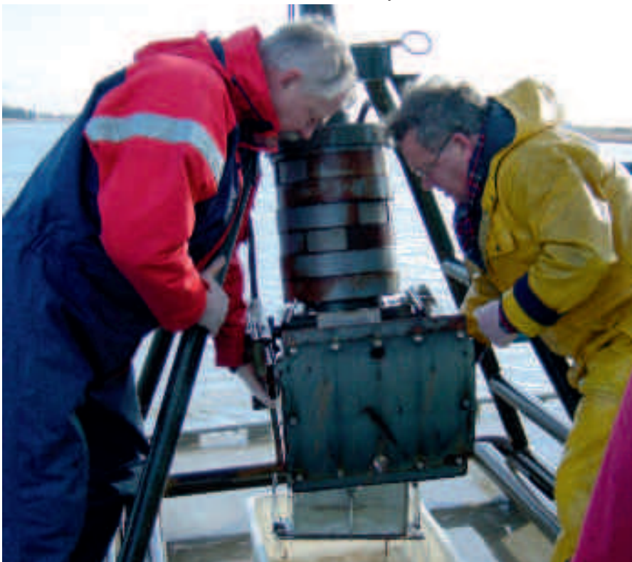
Monsternamen van macrofauna met een Boxcore (foto: Arie Naber, Rijkswaterstaat).