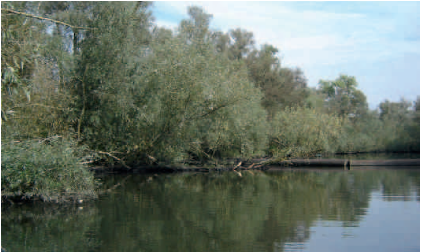
Brabantse Biesbosch, Gat van de Kielen.

aangetroffen die indicatief zijn voor brakke omstandigheden. In beide gevallen (litoraal en profundaal) is de score voor de deelmaatlat zoet water daarom 1,0 (zie hiernaast). In het litoraal van de Hollandse IJssel zijn drie soorten gevonden die indicatief zijn voor brak water: Gammarus duebeni , Hypania invalida en Paranais litoralis . Het monster voldoet met een score van 0,81 echter nog wel aan de voorwaarde voor zoet getijdenwater.