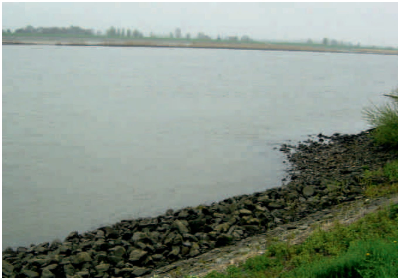
Hollandsche IJssel bij Moordrecht.